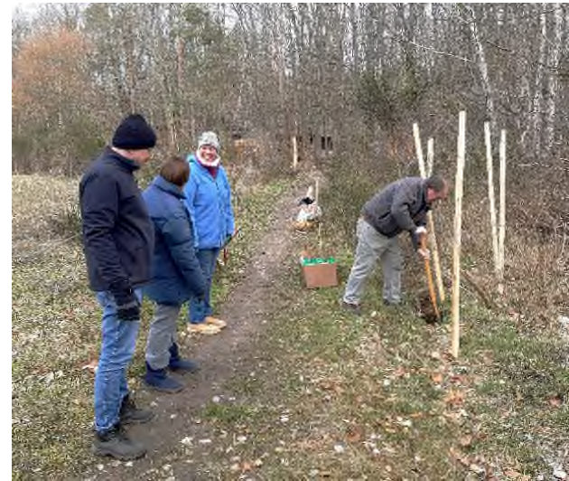
Pflanzung der Kornelkirschen im Museumsdorf

Bereits im zeitigen Frühjahr pflanzte die imkergruppe im Museumsdorf Düppel sieben Kornelkirschen, versehen mit Hinweisschildchen auf das Vereinsjubiläum.