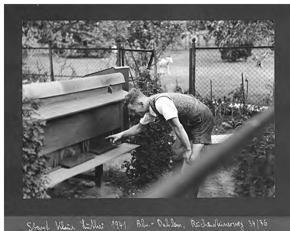
Stand Verein Luther 1941 Bln - Dahlen, Reichswährungsg 34/36