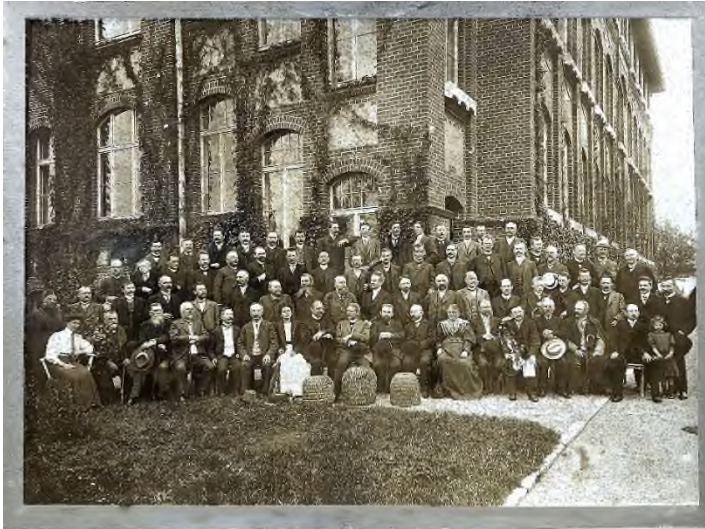
So sahen die Teilnehmer des Lehr-Kurses für Bienenzüchter vor einem Jahrhundert aus: in der Kgl. Gärtner-Lehranstalt Dahlem vom 17. bis 21. Mai 1912.